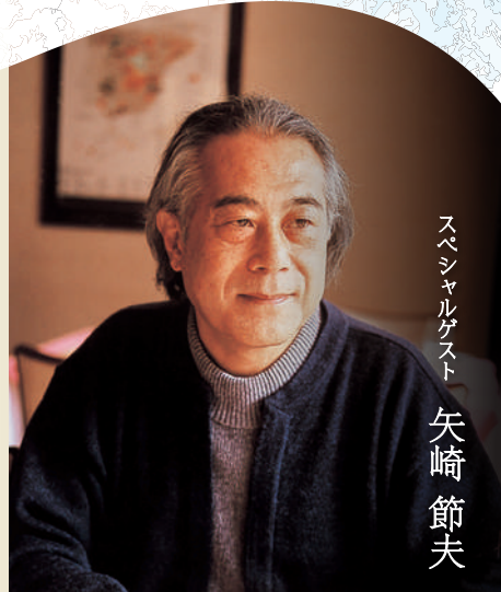
スペシャルゲスト 矢崎節夫